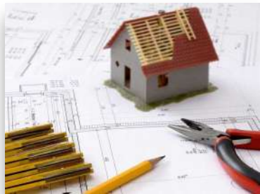
Bauen, Architektur & Infrastruktur