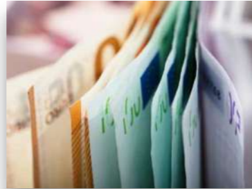
Finanz- und Versicherungswesen