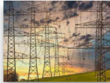
Energie und Energietechnik