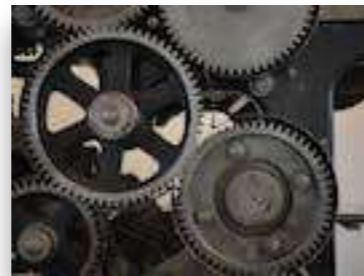
Maschinen- und Anlagenbau/ Automatisierung