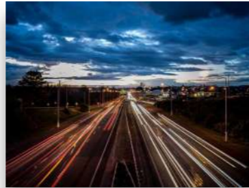
Automotive & Zulieferer