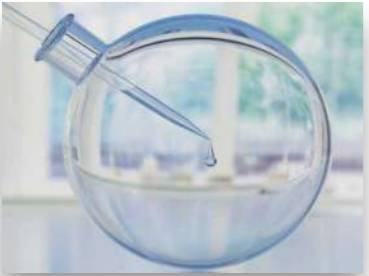
Chemie, Galvanik, Klebstoffe